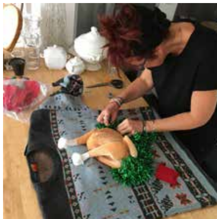
Chaque pull est une pièce unique

Les pulls de Mon pull Moche sont réalisés essentiellement