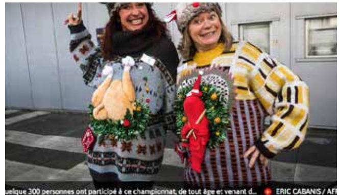
quelque 300 personnes ont participé à ce championnat, de tout âge et venant d...