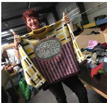
Elles ne tricotent pas, elles recyclent !

Le 17 novembre, une nouvelle marque a débarqué sur le net : Mon Pull Moche. Un concept totalement inédit qui entend réconcilier la tradition du Ugly Christmas Sweater avec les enjeux du développement durable et d'une économie socialement responsable.