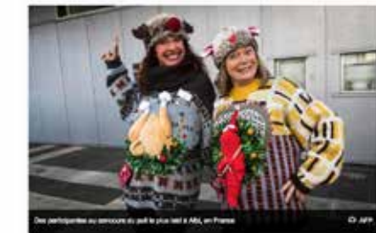
Plus de 300 personnes ont participé à ce championnat, de tout âge et venant d'...

Une photo de deux gagnants du championnat du monde du pull moche.